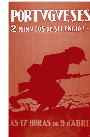
Cartaz editado em 1923 em homenagem aos soldados portugueses que morreram na Grande Guerra.

PORTUGAL ETERNO NOS MARES, NOS CONTINENTES E NAS RAÇAS AO SOLDADO DESCONHECIDO MORTO PELA PÁTRIA NA GRANDE GUERRA 1914-1918.