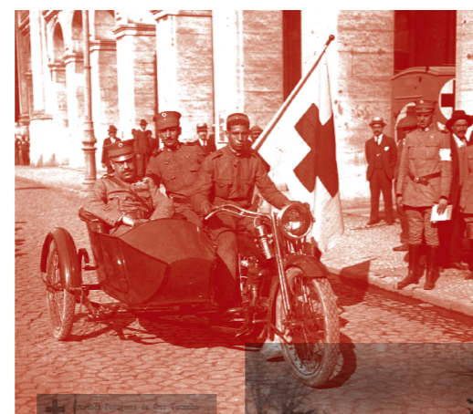
Veículo do Serviço de Saúde português. Terreiro do Paço, Lisboa, 1916.

Médicos e pessoal de enfermagem tiveram que lidar com as consequências físicas e emocionais produzidas pelos avanços tecnológicos, nomeadamente decorrentes dos efeitos do armamento utilizado e da introdução de gases venenosos durante os bombardeamentos. Novas armas, novos ferimentos. Foram aos milhares os mutilados e estropiados, os doentes, os psicologicamente abalados.