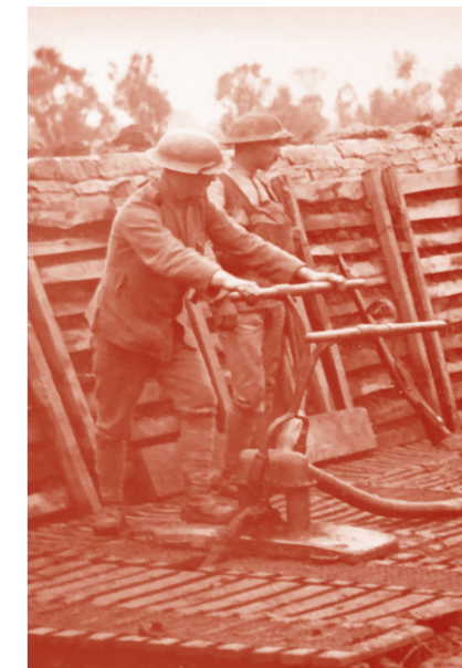
Soldados portugueses a drenar e a limpar uma trincheira. França, 1917. (Liga dos Combatentes, PT AHM-FE-110-A1-PQ-10_m0237)

André Brun, A malta das trincheiras , ed. 1983, p. 89.