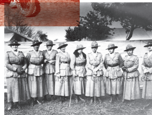
Grupo de damas enfermeiras da Cruz Vermelha Portuguesa em Ambleteuse. França, 1917. (Liga dos Combatentes)