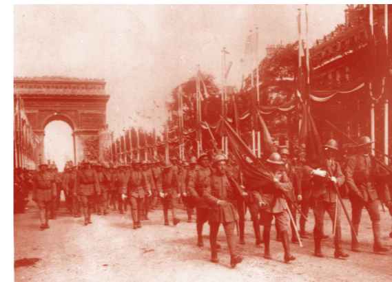
Desfile da Vitória em Paris.

A Grande Guerra teve início com a declaração de guerra de Inglaterra e França à Alemanha e ao Império Austro-Húngaro, em agosto de 1914. Envolveu todos os países europeus, com exceção da Espanha, dos Países Baixos, da Suíça e da região da Escandinávia. Os reflexos políticos deste momento de viragem determinaram o fim do absolutismo monárquico, a revolução russa, o desaparecimento dos impérios russo, austro-húngaro e turco otomano e deram lugar uma nova hierarquia dos países à escala internacional.