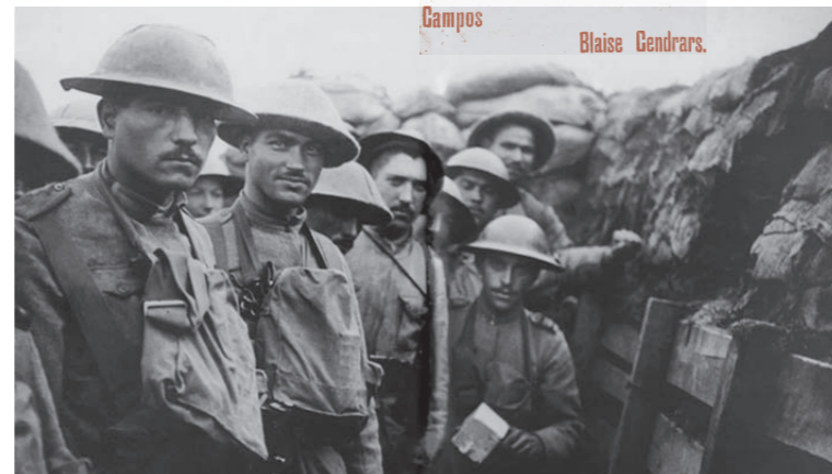
Soldados nas trincheiras, 1917-1918.