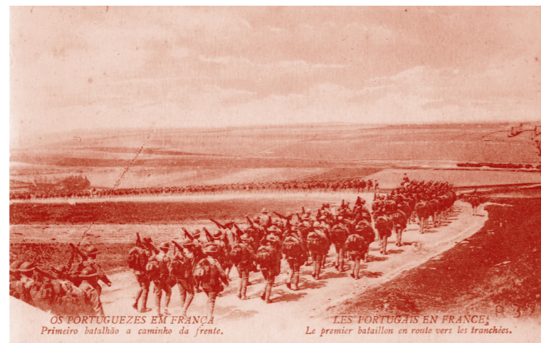
O primeiro batalhão a caminho da frente de batalha num postal alusivo à presença portuguesa em França.