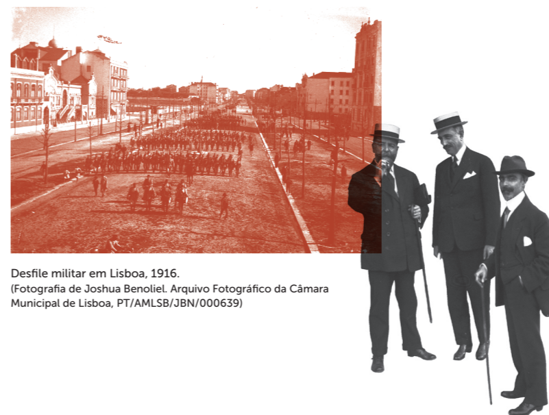
Desfile militar em Lisboa, 1916.

Ao impacto da guerra ficou a somar-se o pesado saldo humano e material da participação portuguesa, e as expectativas frustradas dos que a tinham advogado, desde logo no plano internacional, conforme ficou explícito na Conferência de Paz.