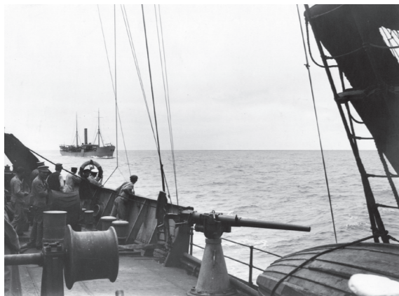
O paquete Cazengo em aproximação ao NRP Gil Eanes para receber instruções através de uma boia salva-vidas, durante uma viagem entre Portugal e França, em 18 de julho de 1917. O Cazengo foi afundado por torpedos pelo submarino alemão U-91, em 8 de outubro de 1918, ao largo do cabo Breton, França.

Desde a entrada de Portugal na guerra até à assinatura do Armistício, a 11 de novembro de 1918, Portugal mobilizou mais de 75 000 homens para a Flandres.