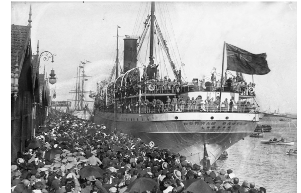
Embarque de tropas expedicionárias para Moçambique no cais de Santa Apolónia. Setembro de 1914. (Arquivo Fotográfico da Câmara Municipal de Lisboa, PT/AMLSB/FRA/000029)

A I Guerra Mundial determinou o percurso da história contemporânea europeia e mundial, provocou fraturas, desencadeou efeitos duradouros que envolveram muito significativamente a História de Portugal. A I Guerra foi, em tudo e para todos, uma rutura em dimensões múltiplas e determinou uma viragem a partir da qual o mundo mudou, e Portugal também.