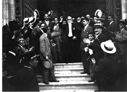
Bernardino Machado à saída da sessão parlamentar extraordinária de 7 de agosto de 1914, que conferiu poderes ao governo para tomar medidas de emergência perante a guerra europeia.

A 4 de agosto de 1914, a notícia da declaração de guerra da Inglaterra à Alemanha chegou a Portugal envolta em tristeza e consternação. Naquele mesmo dia, no telegrama que dirigiu ao ministro britânico em Lisboa, o secretário de Estado dos Negócios Estrangeiros inglês, Eyre Crowe, aconselhou o nosso país a abster-se de proclamar a neutralidade, assegurando que “em caso de ataque pela Alemanha contra qualquer possessão portuguesa, o Governo de Sua Majestade considerar-se-ia ligado pelas estipulações da aliança anglo-portuguesa.” [Manuel Teixeira Gomes, Portugal na Primeira Guerra Mundial (1914-1918) , 1997, p. 17]