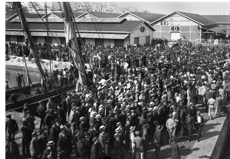
População a assistir ao embarque das tropas portuguesas para África em Santa Apolónia.

Entre 1914 e 1918, Portugal mobilizou cerca de 30 000 homens para combater em Angola e em Moçambique. Grande parte dos militares que integraram estas expedições chegavam a África já doentes, incapazes de resistir às terríveis condições de higiene vividas durante a viagem.